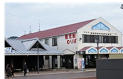
青海島クルージング