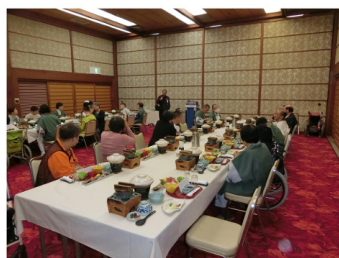
ホテル西長門リゾート