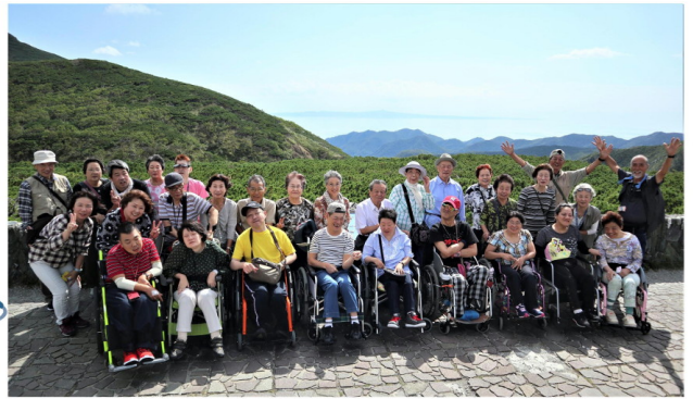
国後島も見れました