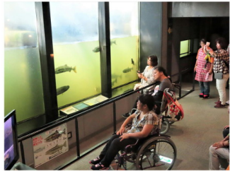
標津サーモン科学館