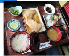
サメガレイの煮つけ