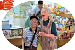
お土産、たくさん買いましたね