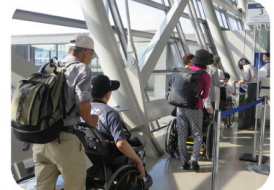
ANAの皆さんには大変お世話になりました