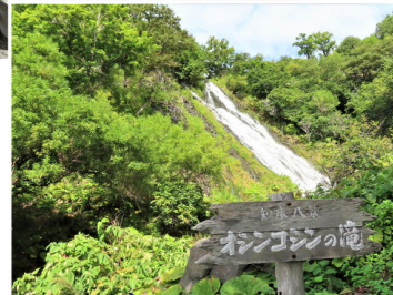
オシンコシンの滝