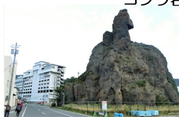
北こぶし知床HOTEL & RESORT